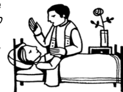
Anointing of the sick