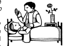
Anointing of the sick