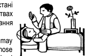
Anointing of the sick