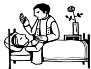
Anointing of the sick