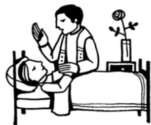
Anointing of the sick