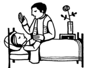
Anointing of the sick