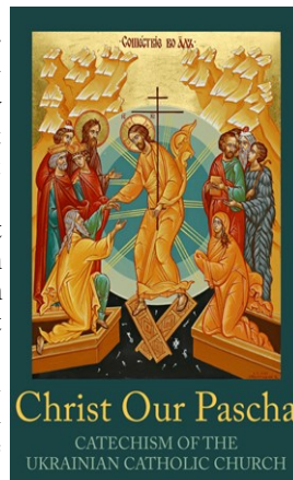
Christ Our Pascha CATECHISM OF THE UKRAINIAN CATHOLIC CHURCH

427 Just as after Christ's baptism in the Jordan the Holy Spirit led Christ in his salvific mission, and just as the Spirit leads the Church community since the descent on the apostles at Pentecost, so also in the Mystery of Chrismation the Holy Spirit grants to every Christian the capacity to discern and realize the foundational calling (vocation) of his or her life for the salvation and transfiguration of the world.