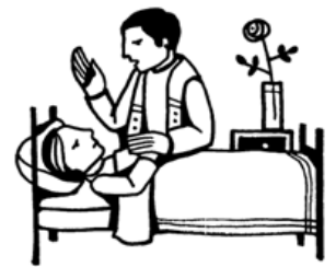
Anointing of the sick