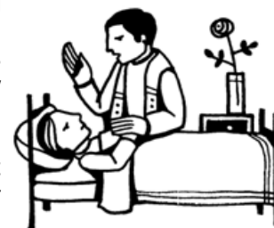
Anointing of the sick

ДЛЯ ТИХ, ХТО ХОЧЕ БУТИ ХРЕСНИМИ БАТЬКАМИ: Хто не є зареєстрованими членами парафії і не приходять до церкви регулярно не можуть бути хресними батьками, і т. д. Щодо хресних батьків, вимагається: щоб людина мала 16 років або старша, повинна бути хрещена, миропомазана та прийняти Святі Тайни Сповіді та Св. Причастя. Якщо одружені, шлюб повинен бути визнаний Католицькою Церквою.