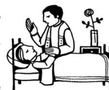
Anointing of the sick

Fast before the Liturgy. It is a Church law that one fasts for at least 1 hour before receiving Holy Communion. Water and medicine can be consumed, of course. The purpose is to help us prepare to receive Jesus in the Holy Eucharist. Please be quiet while in church. Once you enter the church - it is not the time or place to visit with those around you. If you must talk - do so as quietly and briefly as possible. Remember that your conversation might be disturbing someone who is in prayer, which is much more important. Sssshhhh.