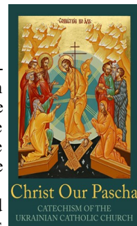
Christ Our Pascha CATECHISM OF THE UKRAINIAN CATHOLIC CHURCH

(will be cont'd in the next weeks bulletins)