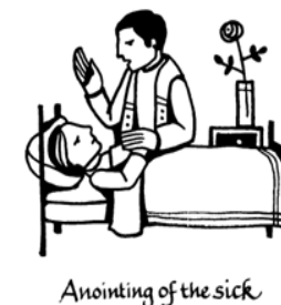
Anointing of the sick